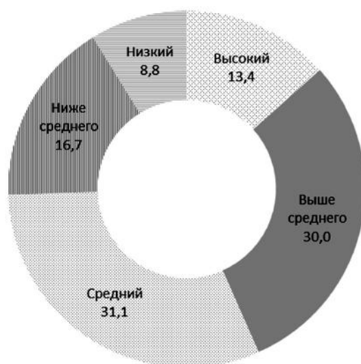
Рис. 2. Уровень социальной солидарности молодежи (в %).

Чем выше уровень материального положения респондентов, тем более активно они включены в систему социальной солидарности (см. табл. 14). При этом важно отметить, что массовая включенности в группы выше среднего и высокого уровня социальной солидарности свойственна отнюдь не только тем, чей материальный статус сравнительно высок: подобный уровень взаимодействий характеризует более трети молодых людей, параметры материальной обеспеченности которых находятся и на среднем, и на низком уровнях.