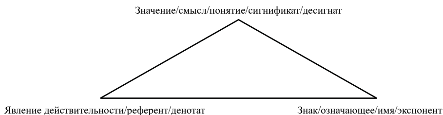
Рисунок 1. Семантический треугольник Огдена-Ричардса [Ogden, Richards 1923, 9–12]

Он также ввел в научный оборот такие важные понятия, как «контекст» и «знаковый континуум». Первое означает ту ситуацию, когда знак или сообщение может менять свое значение и смысл при наличии другого знака или сообщения, дополняющего или сопровождающего его. Второе понятие отражает градуальный характер взаимоотношений знаков. Он заключается в последовательном плавном переходе друг в друга знаков в зависимости от их значения для раскрытия и понимания смысла [Моррис 1983, 119].