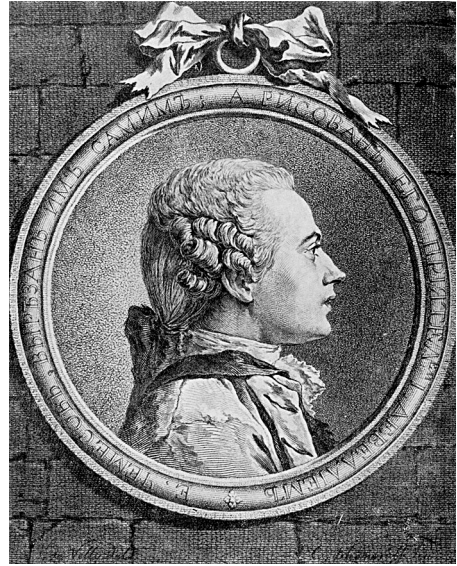
Автопортрет Е. П. Чемесова. 1764–1765 гг.

выполненных выдающимся мастером XVIII в. Е. П. Чемесовым, с именем которого связаны высшие достижения в области портретной гравюры этого столетия.