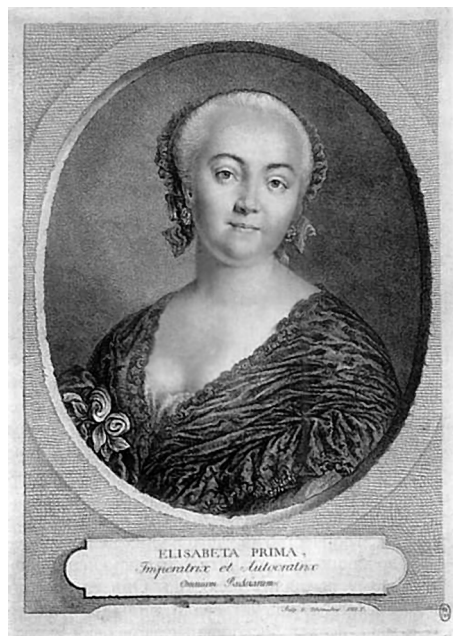
Портрет императрицы Елизаветы Петровны работы Е. П. Чемесова. 1761 г. С оригинала П. Ротари. 1756 г.