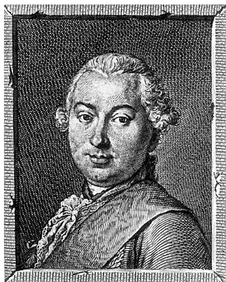
Портрет И. И. Шувалова работы Е. П. Чемесова. 1760 г.