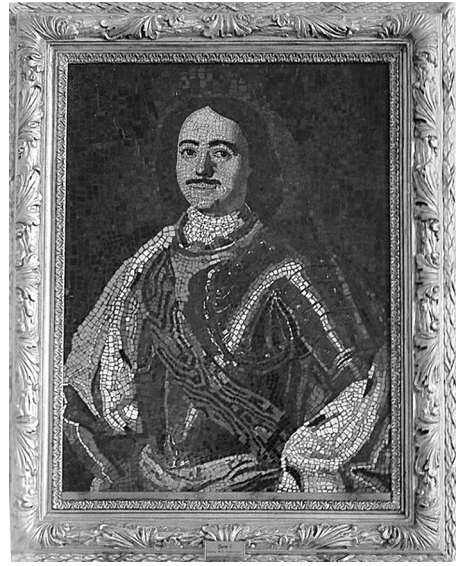
Портрет Петра I. Мозаика работы М. В. Ломоносова по живописному оригиналу Ж. -М. Натье. 1760-е гг.