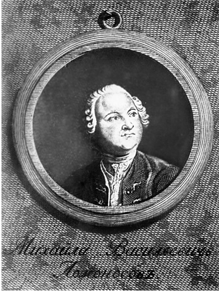
Портрет М. В. Ломоносова работы Е. П. Чемесова. Первая половина 1760-х гг. По рис. Ж.-Л. де Велли