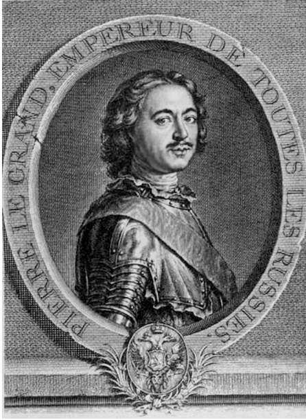
Портрет Петра I для труда Ж.-Б. Вольтера «История Петра Великого» работы Е. П. Чемесова. По живописному оригиналу Ж. М. Натье