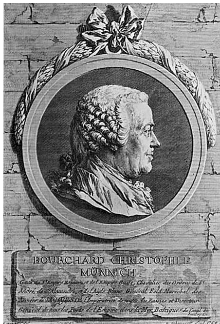
Портрет Б. К. Миниха работы Е. П. Чемесова. По рис. Ж.-Л. де Велли. 1764–1765 гг.