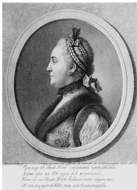
Портрет великой княгини Екатерины Алексеевны работы Е. П. Чемесова. 1762 г. С оригинала П. Ротари. 1760 г.