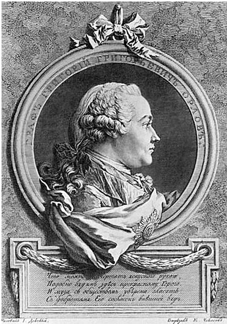
Портрет Г. Г. Орлова работы Е. П. Чемесова. По рис. Ж.-Л. де Велли. 1764 г.