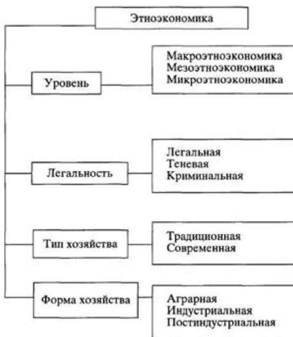
Рис. 1. Структура этнических экономик.

кро- - хозяйство отдельных производственных единиц. Во-вторых, состояние рассматриваемого феномена варьируется также по параметрам легальности, типа, формы хозяйства (см. рис. 1).