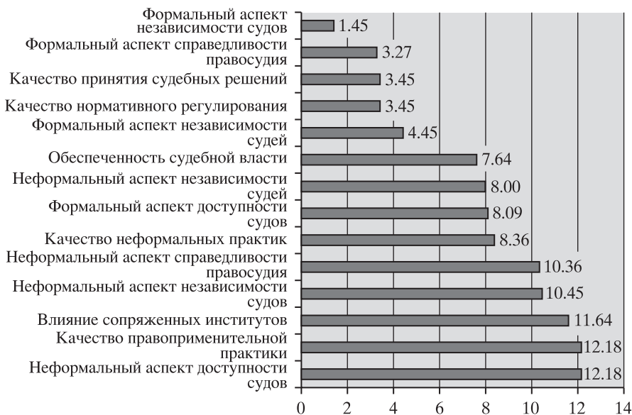
Рис. 3. Средние ранги значений индексов характеристик по шести странам.