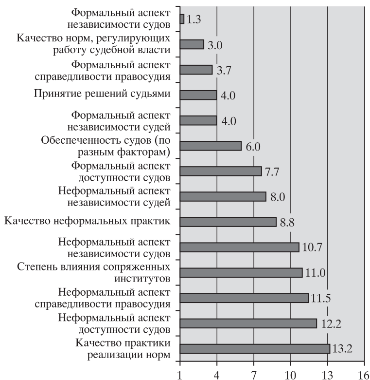
Рис. 2. Средние ранги значений индексов характеристик по всем профессиональным группам.