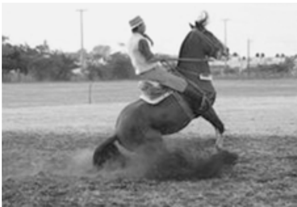
Испытание креольской лошади

мореплаватель Христофор Колумб прибыл к землям далеких «Индий». Именно тогда и началась история лошади в Латинской Америке. Вместе с людьми Колумба с каравелл на землю были спущены лошади, отважно совершившие трансокеанское путешествие вместе с испанскими мореплавателями. Что это были за лошади — прародители креольской породы? Они имели иберо-африканское происхождение 3 и сформировались в процессе естественной селекции, проходившей во времена арабского владычества над Испанией. Из-за жаркого климата севера Африки местные лошади были очень крепкими и выносливыми. Эти качества они передали своим потомкам — испанским лошадям. В основном смешению подверглись лошади южной части Испании, в результате чего и появилась андалузская порода. Официально она была зарегистрирована в Испании только при короле Фелипе II (1556—1598) между 1567 и 1593 г., т.е. уже после того, как первые андалузы попали в Латинскую Америку. Родиной породы является город Херес-де-ла-Фронтера, в котором находился Картезианский монастырь одноименного ордена. Именно монахи этого ордена с 1476 г. начали селекционную работу по выведению андалузской породы.