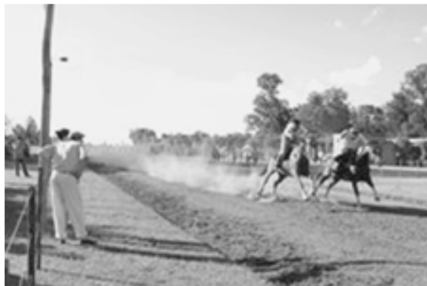
Соревнования на скорость

да к власти Фелипе III (1598—1621) в страну начали активно ввозить иностранных лошадей, в том числе и тяжеловозов, а также вывозить андалузов из Испании, что привело к «утяжелению» породы. Все это случилось в конце XVI в., а Колумб, как известно, отправился в путешествие несколько раньше.