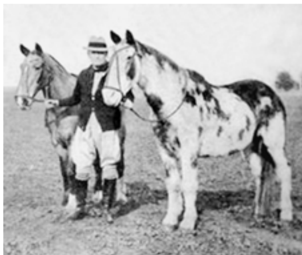
Манча и Гаго

Новая история аргентинской лошади связана с именем врача-ветеринара и зоотехника Эмилио Соланета 4 . В 1904 г. он поступил в Институт агрономии и ветеринарии Буэнос-Айреса, в 1908 г. окончил его с отличием, а два года спустя защитил докторскую. Соланет